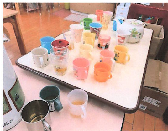
同胞こども園でのふれあい教室の様子

玉露の淹れ方を、子供達の前で担任の先生に体験していただき、子供達には急須で淹れたほうじ茶をマイコップで飲んでもらいました。